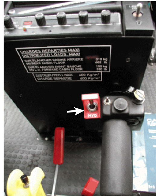
Photo 2. Commutateur CUTOFF du circuit hydraulique et son cache

Le commutateur HYD TEST (photo 3) a été trouvé en position avant ou « Test ». La caractéristique « tirer pour déverrouiller » du commutateur HYD TEST fait en sorte que l'on doit tirer sur le commutateur à bascule,