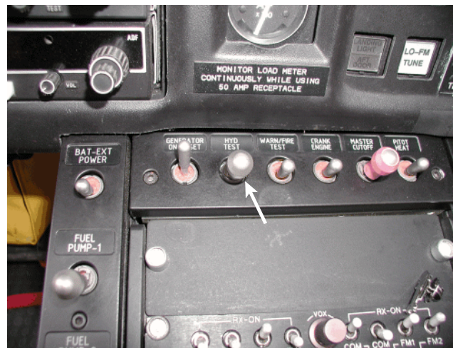
Photo 3. Commutateur HYD TEST du circuit hydraulique