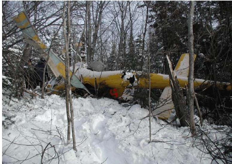
Photo 1. Épave du C-GOGN

À 11 h 43, le pilote a signalé que l'appareil avait subi une défaillance hydraulique et il a décrit la zone de débardage où il allait se poser. Au cours de son dernier message, il a indiqué qu'il s'attendait à un atterrissage de précision difficile. L'hélicoptère s'est approché de la zone de débardage par l'ouest. Cette zone consistait en une vallée traversée par une voie ferrée en direction nord-sud. L'appareil s'est dirigé vers le sud, puis vers le nord au-dessus du relief ascendant situé à l'est de la zone de débardage (voir l'annexe A). Une fois du côté est, l'hélicoptère s'est mis en palier à environ 50 pieds au-dessus des arbres, a poursuivi vers le nord jusqu'à ce qu'il atteigne la partie nord de la zone de débardage, a entamé un virage vers la gauche et s'est dirigé de nouveau vers les témoins. L'hélicoptère est demeuré en virage vers la gauche et incliné vers la gauche de sorte que les témoins, situés à environ 600 pieds au sud, ont pu voir clairement les marques d'immatriculation qui se trouvaient sous l'appareil. L'hélicoptère est descendu vers le relief ascendant et s'est immobilisé sur le dos sur un cap magnétique de 080°. L'accident s'est produit de jour à 11 h 44 par 47° 04' de latitude nord et 084° 04' de longitude ouest et à une altitude de 1456 pieds au-dessus du niveau de la mer (asl) 2 .