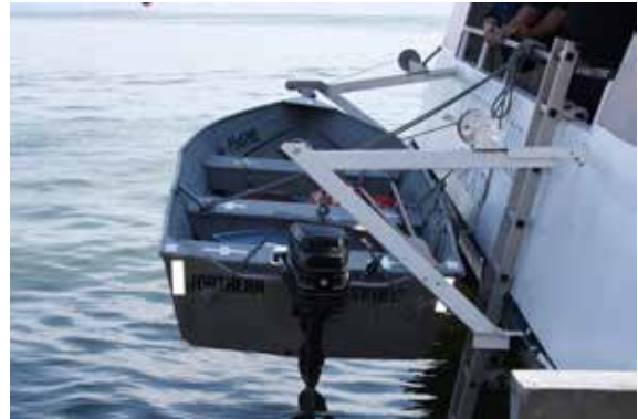
Photo 2. Emplacement de l'embarcation d'urgence à la poupe

La trajectoire d'éloignement du navire traversait le canal ouest du port intérieur de Toronto en direction de la baie Humber. Faisant route, le capitaine en second a effectué une ronde de sécurité et a constaté qu'un passager se trouvait dans une section à accès restreint de la proue. Il a demandé au chef de la sécurité de poster 2 gardiens de sécurité à la proue du navire. Vers 19 h, 2 gardiens de sécurité s'y sont postés pour s'assurer que les passagers n'adoptaient pas de comportements dangereux. Les gardiens ont remarqué un passager qui se comportait de façon instable et semblait être en état d'ivresse.