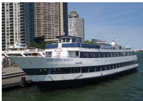
Photo 1. Northern Spirit I

Le Northern Spirit I est doté d'un pont principal, d'un pont supérieur et d'un pont de passerelle (annexe B). La passerelle se trouve à l'avant, sur le pont de passerelle, et l'on y retrouve 1 compas magnétique, 1 échosondeur, 1 système mondial de positionnement pour navigation satellite (GPS) et 1 radiotéléphone à très haute fréquence (VHF).