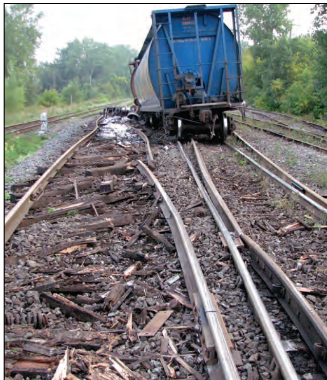
Photo 1. Dommages aux voies et aux branchements

La structure de la voie principale sud et celle de la voie de raccordement nord ont été détruites sur une distance d'environ 325 pieds (Photo 1). Jusqu'au premier wagon déraillé, soit 300 pieds plus à l'est, le rail nord de la voie de raccordement nord a été déplacé latéralement et s'est renversé. Des signaux nains et plusieurs composantes des branchements 423 et 421A, incluant des mécanismes de manœuvre, ont été endommagés ou détruits.