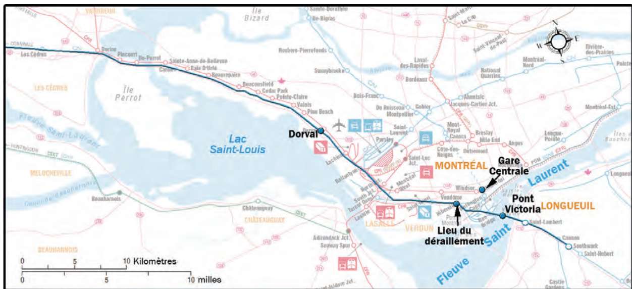
Figure 1. Carte du lieu de déraillement

L'équipe de train est composée d'un mécanicien de locomotive et d'un chef de train. Ils satisfont aux exigences en matière de repos et de condition physique et répondent aux exigences de leur poste respectif.