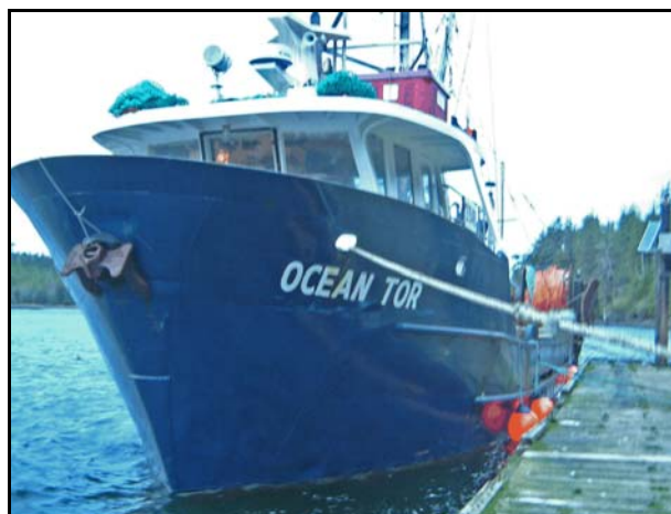
Photo 1. L' Ocean Tor

L' Ocean Tor était un petit chalutier ponté à coque à double bouchain en acier soudé, avec un pont de gaillard surélevé. La coque sous le pont principal était divisée en six compartiments par cinq cloisons transversales étanches à l'eau et abritait les emménagements avant; le compartiment moteur; les cales à poisson avant (bâbord et tribord); les cales à poisson arrière (bâbord et tribord); les cales à glace (bâbord et tribord) ainsi que la cambuse qui abritait les réservoirs de carburant bâbord et tribord et le compartiment de l'appareil à gouverner situé dans l'axe longitudinal. Il y avait également deux réservoirs de carburant dans le compartiment moteur. Deux citernes d'eau douce et une citerne de ballast étaient situées en