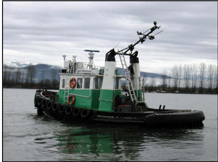
Photo 2. Le remorqueur Tiger Shaman , avec son mât baissé à 45 degrés

Le Tiger Shaman est un remorqueur en acier basé à Mission (Colombie-Britannique). Il ne possède pas de cabines à couchettes. Il est utilisé comme navette, sous la conduite d'un capitaine breveté secondé par un matelot durant les opérations de remorquage sur le fleuve Fraser. La timonerie est dotée de fenêtres sur les quatre côtés, et le pupitre de commande principal se trouve face au centre des fenêtres avant. L'ensemble d'instruments de navigation comprend un compas magnétique, un échosondeur, deux radios VHF et un radar. Un poste de commande secondaire se trouve au sommet de la timonerie. Le treuil de remorquage est situé sur le pont principal derrière la timonerie, entre deux conduits d'échappement moteur verticaux (voir la photo 2).