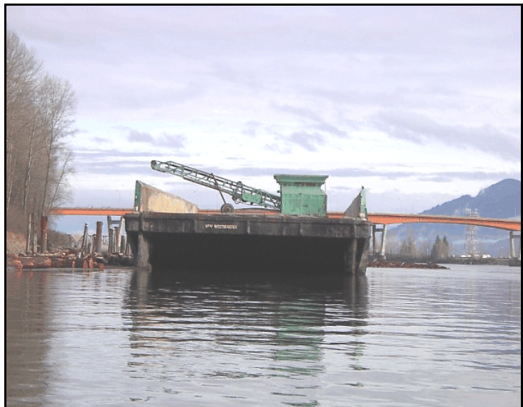
Photo 3. Vue d'une extrémité du chaland Packmore 4000

Il s'agit d'un chaland sans équipage et sans moyen de propulsion.