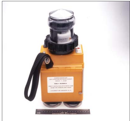
Photo 4. Feu de navigation à DEL pour chaland

L'enquête du BST sur l'abordage de 1999 entre l'embarcation de plaisance Sunboy et le remorqueur Jose Narvaez remorquant le chaland Texada B.C. (M99W0133) a déterminé que le feu portable utilisé sur le chaland ne respectait pas les exigences minimales de portée. En conséquence, l'industrie du remorquage et Transports Canada ont cherché une solution. Des feux de navigation pour chalands fabriqués aux États-Unis et respectant la réglementation pertinente de la Garde côtière américaine ont été soumis à des essais, et Transports Canada a constaté qu'ils répondaient aux exigences du Règlement sur les abordages et aux Normes concernant les feux de navigation, marques, appareils de signalisation sonore et réflecteurs radar , TP 1861, et pouvaient être utilisés sur des chalands sans équipage en eaux canadiennes. Ces feux approuvés recourent à la technologie des DEL (voir la photo 4).