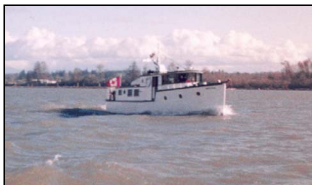
Photo 1. L'embarcation de plaisance Mistral

Le Mistral était une embarcation de plaisance en bois faisant un peu plus de 15 tonneaux de jauge brute. Il était propulsé par un seul moteur à essence de 112 kW, situé entre la cabine à couchettes en « V » à l'avant et le salon principal à l'arrière. La timonerie surélevée, située au-dessus du compartiment moteur, comportait sept fenêtres verticales disposées en